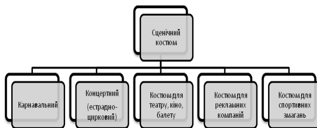
Рис. 4.2. Різновиди сценічного костюму за призначенням

Загалом, будь-який з визначених різновидів сценічного костюма гармонізує загальне враження від того, що відбувається на сцені, як для глядача, так і для митця, або спортсмена.