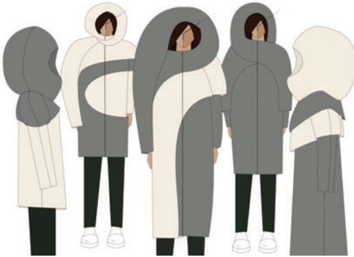
Рис. 4.2. П'ятифігурна композиція авторської колекції одягу.

Система побудови колекції – комплект; основний асортимент – пальто, трикотажні штани; загальний символ-форма колекції – овал, прямокутник; довжина та об'єм – при зіставленні ряду форм за величиною спостерігається її перевага за розмірами однієї форми над іншою, масивні деталі врівноважені за рахунок довжини виробів; домінанти – капюшони; напрямок та характер ведучих конструктивних ліній – пластичні, заокруглені лінії, що мають здебільшого діагональний напрямок (рис. 4.2).