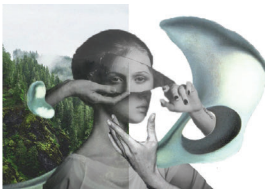
Рис. 4.3. Асоціативний колаж психологічної та колористичної відповідності.

Для відображення ідеї колекції та передачі психоемоційного настрою було створено асоціативний колаж психологічної та колористичної відповідності (рис. 4.3).