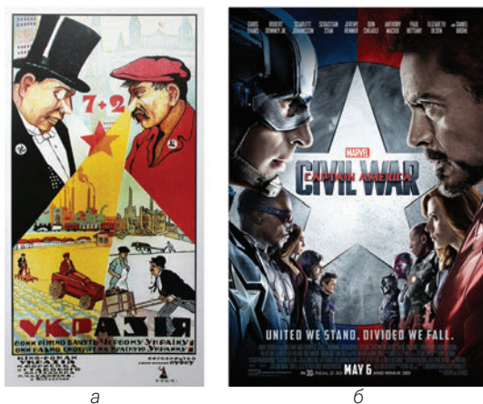
Рис. 4.6: а, б. Наслідування композиційної схеми плакату «Укразія» А. Мартинова голлівудським постером (?).

Цікаво, що автор плакату «Укразія. 7+2» (припустимо, що це А. Мартинов) сам став «жертвою» позичання композиційної схеми майже через століття (рис. 4.6). Подивимось на «Укразію. 7+2» і постер до голлівудського блокбастера за коміксами Marvel – «Captain America. Civil War» (Marvel Studios, 2016). Схожість не викликає сумнівів. Власне, можна припустити, що ймовірний автор «Укразії» сам свідомо або підсвідомо міг надихнутися класичними зразками симетричної композиції, які зустрічались під час навчання, припустимо, у Академії або у мандрівках українськими містами для написання пейзажів для серій листівок. До таких зразків можемо віднести як давньоруську іко-