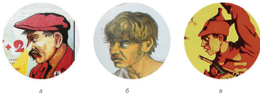
Рис. 4.2: а, б, в. Моделювання персонажів на афішах: а) не ідентифікований плакат «Укразія»; б), в) ідентифіковані плакати «Лісовий звір» (горизонтальний), «Лісовий звір» (вертикальний).