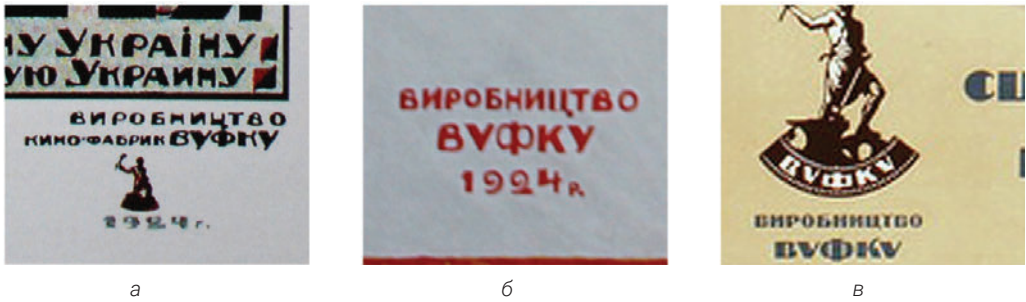
Рис. 4.4: а, б, в. Схожість додаткових шрифтів на афішах:

а) «Укразія», б) «Лісовий звір» (горизонтальний), в) «Лісовий звір» (вертикальний)