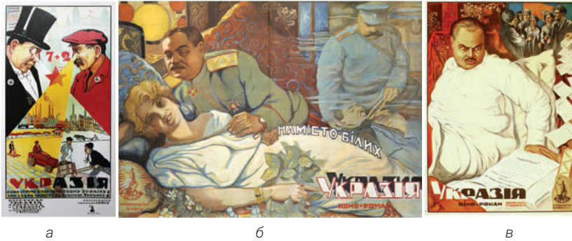
Рис. 4.1: а, б, в.

а) Невідомий автор. Україзя. 7+2: Вони різно бачуть Червону Україну. [1924]. Хромолітографія. 186,4 x 109. Москва.