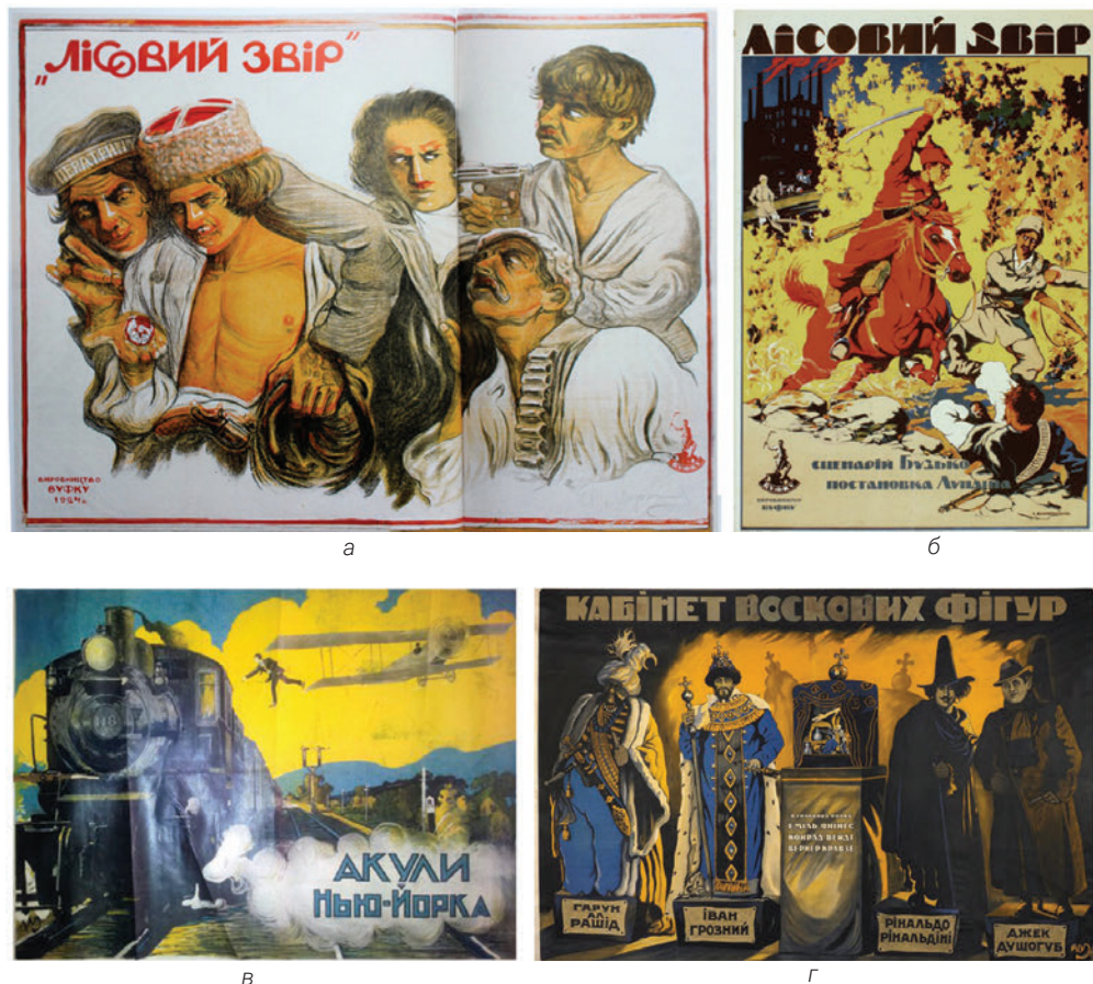
Рис. 5.1.: а, б, в, г. Кіноплакати А. Мартинова:

а) А. Мартинов. Лісовий звір. Хромолітографія. 106 x 142. [1924].