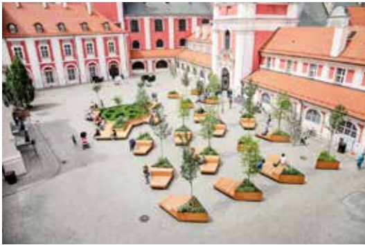
Рис. 4.4. Двір мерії у місті Познань. Польща.