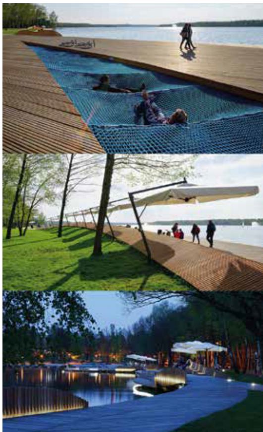
Рис. 4.3. Набережна міста Тихи. Польща.

з найбільш успішних прикладів як польського, так і світового творення громадських просторів. Оновлена в 2014 р. рекреаційна зона базується на дерев'яних доріжках, прокладених вздовж берега озера (рис. 4.3). Окрім того, що простір знаходиться поруч із водоймою, в його облаштуванні використано чимало світлих поверхонь, тентів, що створює комфортні кліматичні умови. Наповнений різними функціональними додатками, такими як велосипедні доріжки, зони відпочинку «гаманкового» типу, багатофункціональні поверхні вуличних меблів, він притягує велику кількість користувачів.