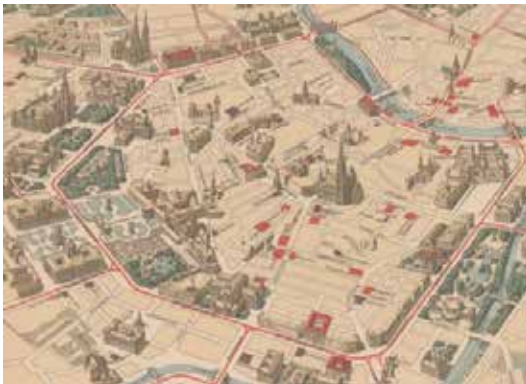
Рис. 4.1. План-схема організації вулиці-алей Рінгштрассе. Відень.

Як вдалий приклад із світового досвіду можна виокремити замовний конкурс на забудову вулиці-алей Рінгштрассе у Відні (XIX ст.) (рис. 4.1), де практично вперше відбувся конкурс не на окремий архітектурний об'єкт, а на грандіозний міський ансамбль із поєднанням архітектурних об'єктів та міських просторів різного призначення. Важливо, що такий кільцевий бульвар, який розмістився на місці вже непридатних доволі укріплень старого міста, мав виконувати нові цілі. Їх особливість полягала у великій увазі до презентативних функцій міста і проявлялась у відведенні достатньо великих територій