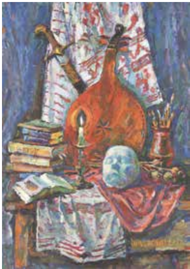
Рис. 4.1. В. Забашта. «Пам'ятай, що живеш», 2003. Полотно, олія.