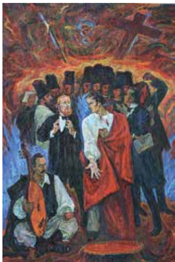
Рис. 4.5. В. Забашта. Прометей духу. 1991–2008.

Творчість Василя Забашти ми сьогодні намагаємося структурувати як внутрішню культуру й громадянську свідомість українства. Його живопис дозволяє долучитися до високого поняття «духовна Україна», і не лише словами й теоретичними вправами ерудованого інтелекту, але й особисто вистражданим шляхом власного досвіду, світоглядної культури та відданості мистецькій ідеї (рис. 4.5).