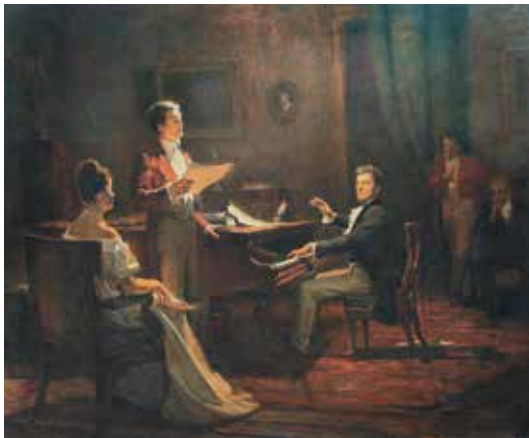
Рис. 4.2. В. Забашта. С. Гулак-Артемовський і М. Глінка. 1950. Полотно, олія.