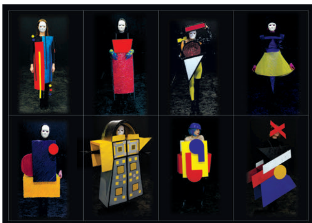
Рис. 6. Роботи студентів 1 курсу КНУКіМ. 2020 р. Авангардний одяг з нетрадиційних матеріалів за мотивами творчості Баугаузу.

Четвертий етап роботи, який полягав у відтворенні проектного рішення в матеріалі, був найбільш експериментальним і найбільш цікавим з погляду креативності. Зберігаючи концептуальні домінанти ваймарської школи у поєднанні з авторським рішенням, було створено колекцію одягу. У такий спосіб студентам вдалося створити дизайн, який у сучасних умовах стає актуальним відлунням легендарної епохи змін і авангардного мислення (рис. 6, 7).