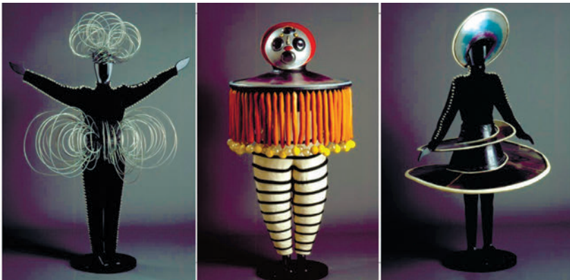
Рис. 1. Оскар Шлеммер. Тріадний балет: Дротова фігура, 1922. Нікелевий дріт, метал. Збірка Штутгартської міської галереї.

У формотворенні костюмів використано папір, дерево, дроти і трубчасті форми. Масивні костюми перетворювали людину на типаж; костюм стирав межі статі, фігури, індивідуальних рис обличчя, а режисерський задум акцентував тріаду кольору (жовтий, синій, червоний), простору (висота, ширина, глибина); основних геометричних форм (квадрат, трикутник, коло) (Сидельникова, б.г.). Друга версія балету складалась з трьох