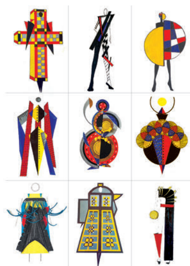
Рис. 5. Роботи студентів 1 курсу КНУКіМ. 2020 р. Графічна експлікація ескізного рішення дизайну одягу.

Третій етап роботи над проектом полягав у розвитку концептуальних рішень з наближенням костюмів до антропоморфних форм. Цей етап передбачав перехід з площинного ескізного рішення у просторове. Важливо було визначити, у який спосіб площинне графічне зображення має стати об'ємною формою, яку можна одягнути на тіло людини. При цьому треба було враховувати ті конструктивні опорні пояси, на яких має триматись костюм. Складність виконання даного етапу полягала у потребі гармонійного поєднання форми одягу з тілом людини. При цьому особлива увага зверталась на збереження художньо-естетичного рішення, на гармонійне розуміння композиційної цілісності (рис. 5).