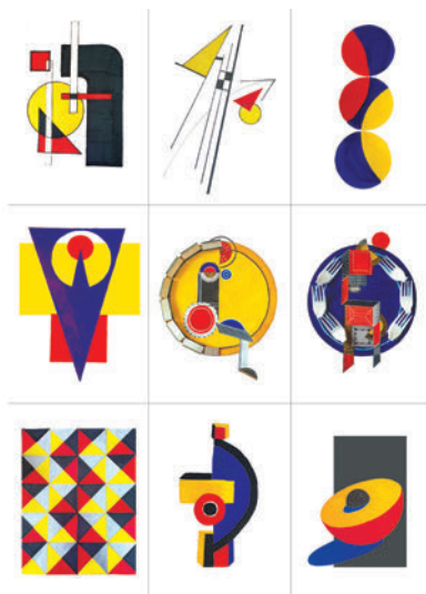
Рис. 4. Графічні асоціативні роботи студентів 1 курсу КНУКіМ. 2020 р.