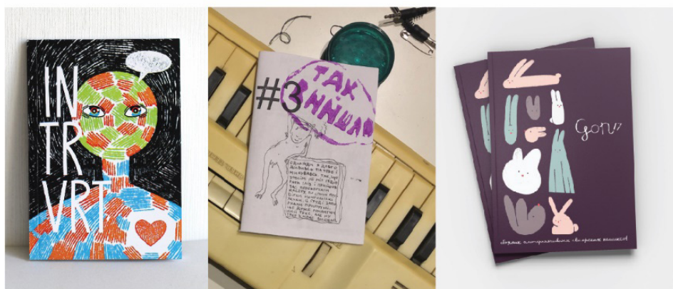
Рис. 5. Українські зіни-комікси: INTRVRT, ТАК ВИЙШЛО #3, GON#17.