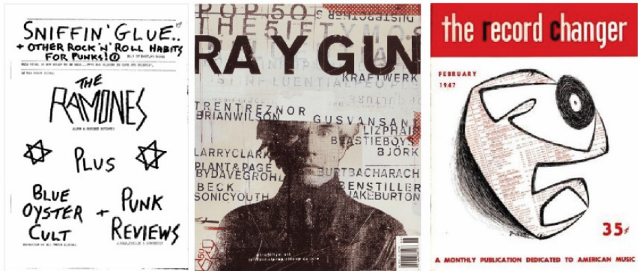
Рис. 2. Тематика панк-року, рок-н-ролу, джазу. Зіни: Sniffin'Glue, Ray Gun, Record Changer.