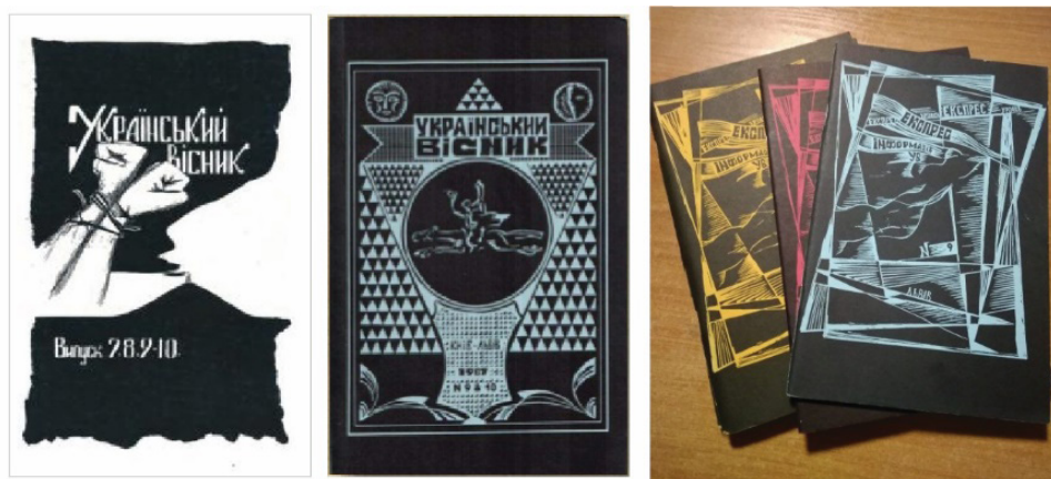
Рис. 4. Самвидав В. Чорновола. Трансформація Українського Вісника від товстого журналу до короткої версії «УВ-Експрес».