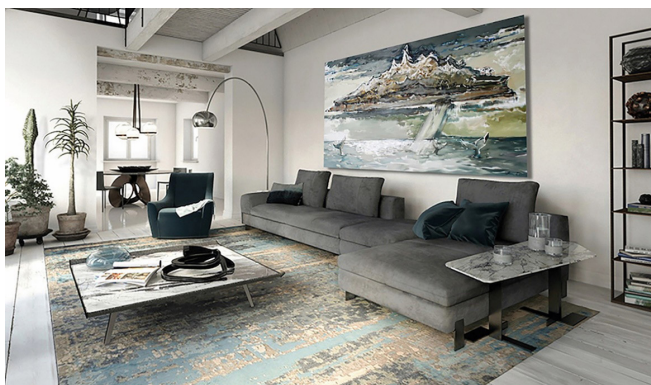
Рис. 1. Олег Ясенєв. Острів, що літає. Полотно, олія. 115x210 см. 2016. Проект розміщення картини в інтер'єрі.

Сучасне мистецтво здатне чудово доповнювати мінімалістично вирішені інтер'єри. Важливою в даному разі є взаємодія з простором. Застосування певних художніх прийомів дозволяє створювати ефект розширення простору, а сюрреалістичні поєднання, як на картині «Острів, що літає» (рис. 1), дозволяють розширити й межі уяви. Такі аспекти також важливі для релаксації людини.