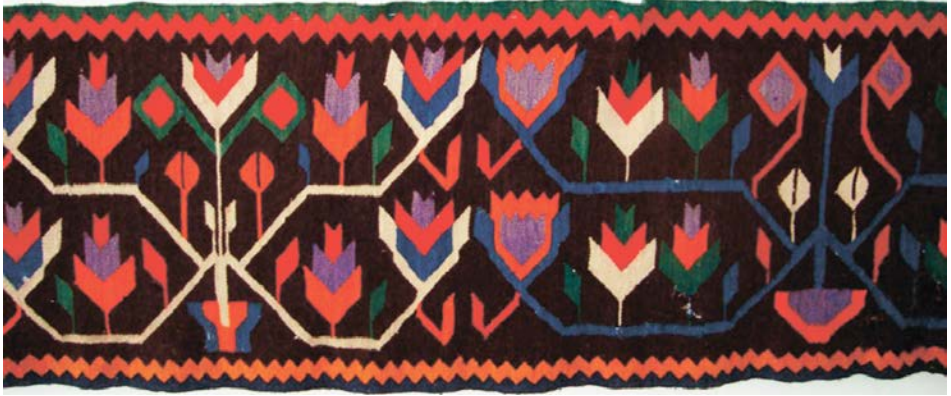
Рис. 2. Килим (фрагмент). с. Кривецьке, Вінницька обл. З колекції В. Косаківського (поч. XX ст.).