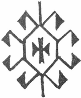
Рис. 5. Мотив «раки».