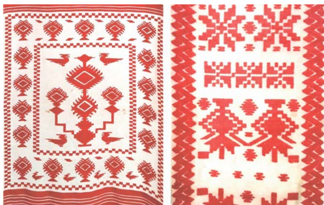
Рис. 1. Кролевецькі рушники (фрагменти). Фонд Музею Кролевецького ткацтва (XIX – поч. XX ст.).

Проблему визначення геометричного орнаменту можна прослідкувати на прикладі кролевецьких тканих рушників (рис. 1). З одного боку, весь орнамент складається зі спрощених геометричних фігур, що дає підстави віднести даний орнамент до геометричного. З іншого боку, можна чітко прослідкувати зображення птахів і квітів, завдяки чому можна використати поняття «зооморфний» та «рослинний». У публікаціях, що стосуються кролевецьких рушників (Заїка, 2017; Серих, 2017), елементи орнаменту рушників відносять і до геометричних, і до орнітоморфних, і до рослинних, що піддаються геометризації.