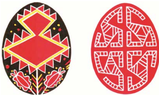
Рис. 4. Писанки «вазон» (зліва) та «павучки». З альбому Е. Біняшевського (поч. XX ст.).