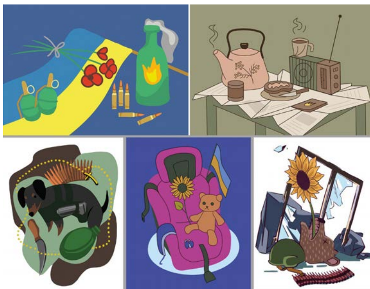
Рис. 1-5. Творче завдання з дисципліни «Рисунок і живопис» на тему «Натюрморт війни».

Для надання нового змісту подіям, їхнього переосмислення, а також саморефлексії, відстежування власних емоцій та переведення їх з площини суб'єктивного в площину об'єктивного були введені творчі завдання відповідної тематики. Таким, зокрема, став «Воєнний натюрморт» (рис. 1 – 5). Кожен зі студентів намагався в образному рішенні втілити свої переживання, роздуми, надії. Сюжети нав'язані численними інформаційними повідомленнями, інтерв'ю, фоторепортажами з передової, що поширені у соціальних мережах.