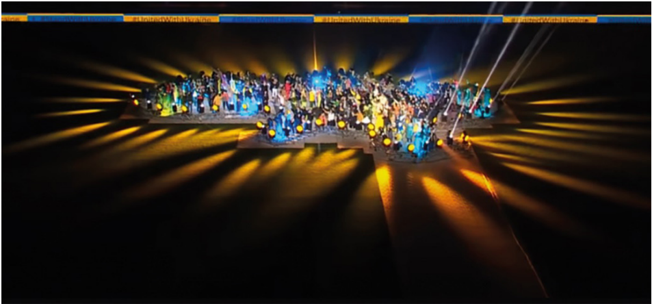
Рис. 3. Знімок з екрану відео мистецького перформансу на благодійному футбольному матчі київського «Динамо» Match for peace #StopWarInUkraine.

Під час цього заходу було зібрано кошти на підтримку військових Збройних Сил України. Режисура виступу мала на меті підвищити емоційну напругу та заохотити глядачів до активної участі в благодійному дійстві.