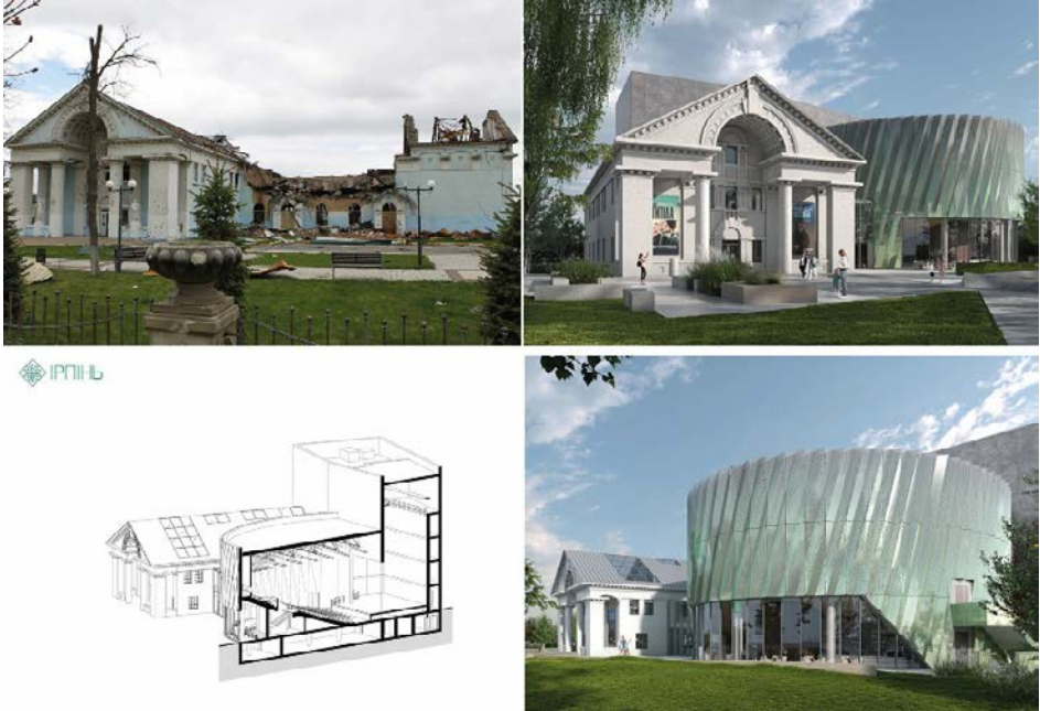
Рис. 4а. Будинок культури в Ірпені після російського нашествя. Квітень, 2022 (Гриб, 2022).