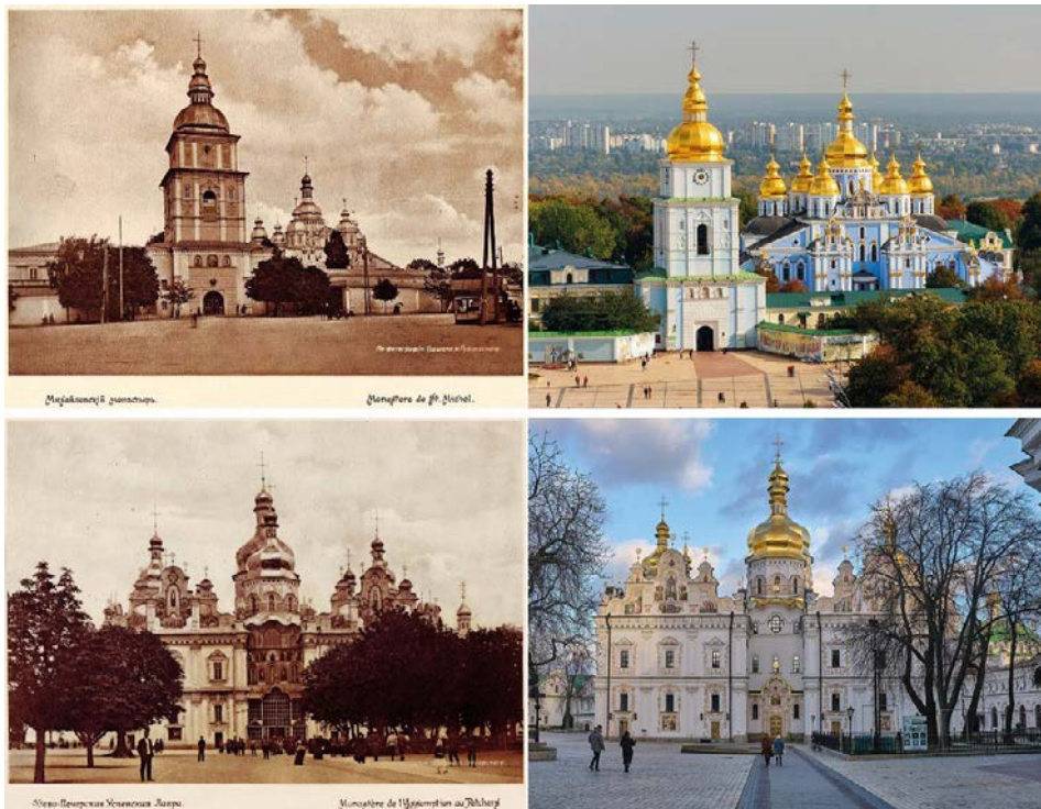
Рис. 1а. Михайлівський Золотоверхий собор, який було підірвано за наказом радянської влади у 1937 р. Фото з поштівки 1911 р. (Гудшон & Губчевський, 1911b).