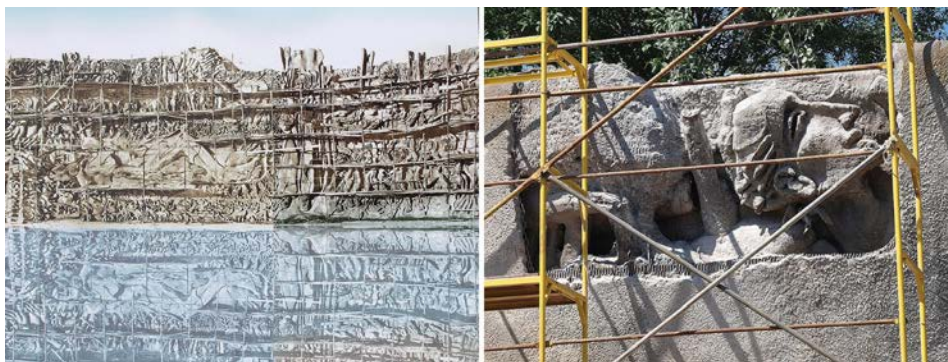
Рис 3а. Ескіз Стіни пам'яті – монументальної композиції на Байковому цвинтарі у Києві, пам'ятки радянського модернізму (Rasal Hague, 2018a).