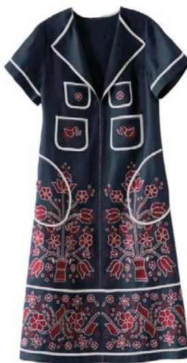
Рис. 3а. Лляна сорочка з вишитими містами-героями Smilyvist від бренду Etnodim (Лляна сорочка, б.д.).