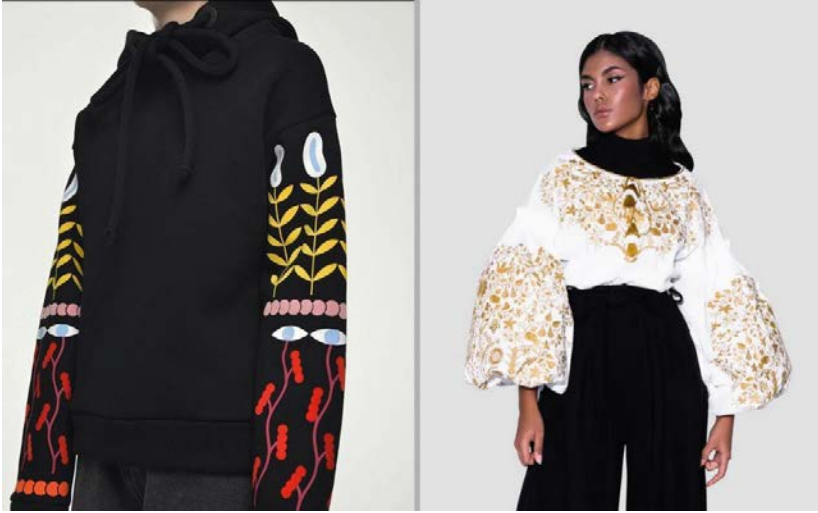
Рис. 1а. Ukrainian Style Sweatshirt/ Black by RCR Khomenko (Ukrainian style, n.d.).