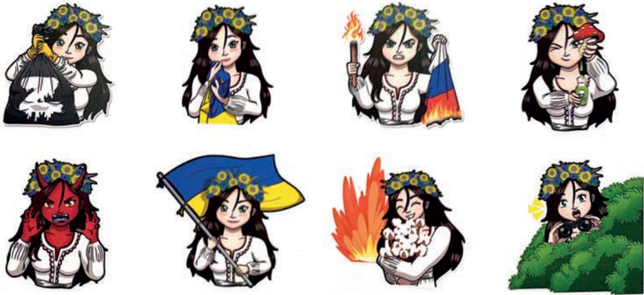
Рис. 5. Анонімний автор. Стікери «Злої Мавки» для чату в Телеграм.

Також у дизайнерському арсеналі групи знайдемо стікери для чату у Телеграм, які ілюструють прийоми з партизанської діяльності спільноти (рис. 5). Наприклад, мавка трусить чорний сміттєвий пакет із літерою Z, спалює російський трико- лор, перетворюється на міфічну істоту, отруює їжу інтервентів, слідкує за окупантами, бавиться з «бавовною», плекає україн- ській прапор.