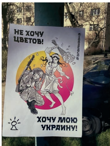
Рис. 3. Анонімний автор. Плакат у міському середовищі Мелітополя. Фото автора з виставки «Небачена сила» у Національному культурному центрі «Український Дім». 2024 р.

До активу групи належать плакатні серії, які розвішувалися у місті, захопленому російським агресором (рис. 3, 4). Носії принципово виконуються у візуальній стилістиці, близькій до коміксу, і підписуються мовою окупантів та використовують їхню символіку із розрахунку на певну target group.