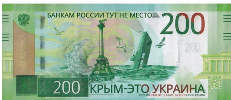
Fig. 6, 7. Anonymous author. Processing of Russian currency signs.