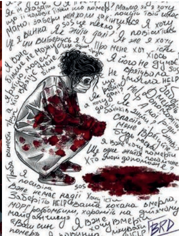
Рис. 12. Валерія Лазебнюк. Люцифер. 2022.