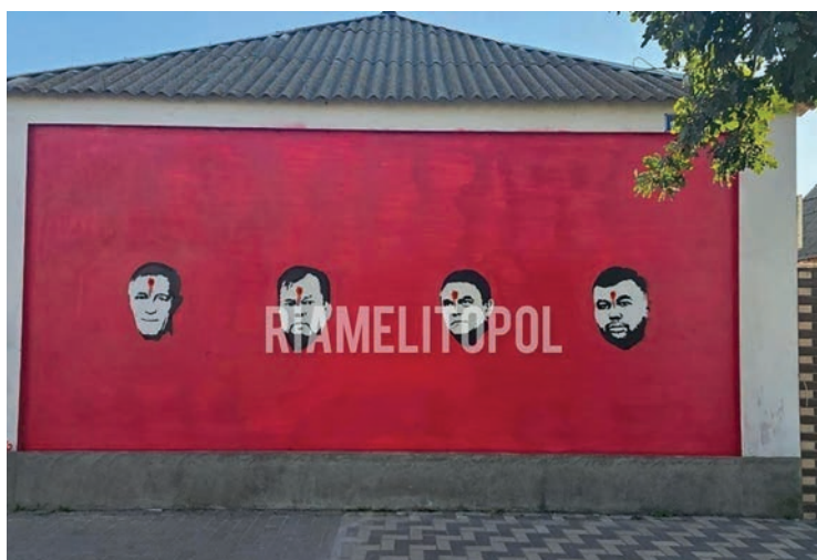
Рис. 8. Анонімний автор. Графіті. Генічеськ. Джерело: Зла Мавка. Телеграм-канал (Зла Мавка, б.д.).