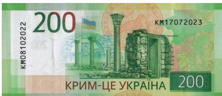
Рис. 6, 7. Анонімний автор. Опрацювання російських грошових знаків.

техніка трафаретного відбитка, яку практикує британський анонімний митець Бенксі для своїх візуальних метафор. Для стилістики характерні площинні заливки, спрощене силуетне трактування форми, обмежена кількість кольорів, розмір трафарету, який можна сховати на тілі, щоб не потрапити до рук патрулів. Гостре рішення має миттєво зчитуватися, оскільки навіть розглядання або фотографування такого твору на стінці теж може бути причиною арешту.