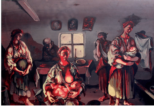
Рис. 2. Валентин Гордійчук. Ілюстрація до поеми Т. Шевченка «Наймичка». 1989.