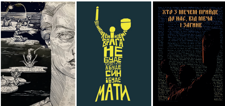
Рис. 14. Ave libertatemaveamor. Без назви. 2022.

ти монумент осторонь від цього дослідження (рис. 14, 15, 16). Молоде покоління графіків-дизайнерів трактує цей символ на рівних із, припустимо, іконою Покрови Божої матері, віддаючи данину феміній сутності поняття «батьківщина», яке, хоч і має корінь «батько», та саме слово визначається жіночим родом.