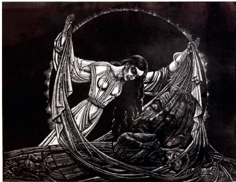
Рис. 3. Василь Лопата. Смерть. Ілюстрація до поеми Л. Костенко «Маруся Чурай». 2001.

Доволі поширена така рольова модель жіноцтва, як оплакування загиблих, що присутня у творах А. Базилевича (рис. 4) і В. Гордійчука періоду 1980-х рр. (рис. 5). Таке дійство може бути як за фактом смерті, що вже відбулася (вдови у В. Лопати, А. Базилевича), так і у передчутті неминучої загибелі (матері у В. Гордійчука). Символічно, що у більшості випадків обличчя закриваються руками, ніби художник боїться показати його вираз, використовуючи лише фігуру у символічній позі. Прикметно, що навіть у часи незалежності такі корифеї жанрової ілюстрації, як В. Лопата, продовжують стилістику і форму подання цікавої нам теми, використовуючи власні набутки ще з радянських часів (рис. 3).