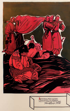
Рис. 4. Анатолій Базилевич. «Взмостили воїни на плечі...». Ілюстрація до поеми І. Котляревського «Енеїда». Ч. VI. 1982.