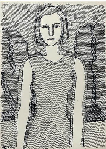
Рис. 1. Григорій Гавриленко. Жіночий образ. Ілюстрація до Данте Vita Nova . 1964. ("Жіночий образ", 2020)

Об'єктність жіночих персонажів може бути як меланхолійно-споглядальною (Г. Гавриленко, рис. 1), так і депресивно-пригніченою, спричиненою впливом негативних зовнішніх факторів: війни, злиднів, епідемій тощо (В. Гордійчук, рис. 2).