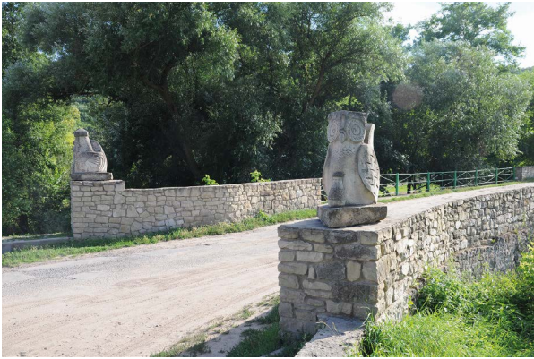
Рис. 1 Дизайнерські обереги «Сова» і «Півень». 2013. Пісковик. с. Буша.

«Скульптура в природному середовищі» – так звучала назва бушанського симпозіуму в 2013 р. Під час заходу виконали дизайнерські витвори, якими оформили місцевий міст через річку Бушанку. Це так звані кам'яні стовпи-обереги у вигляді казкових звірів (рис. 1).