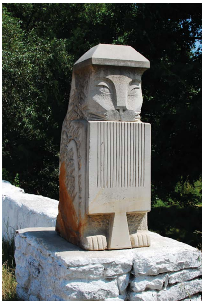
Рис. 2. Є. Троценко. Кіт. 2013. Пісковик. с. Буша. Світлина Г. Троценко.