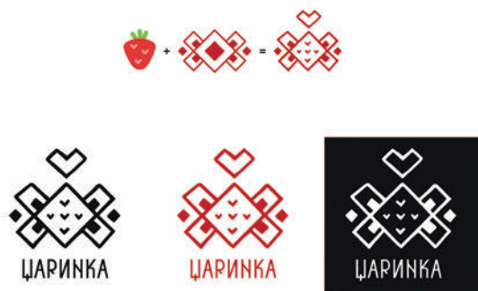
Рис. 1. Вероніка Кулик. Фірмовий знак для виробника сублімованої продукції «Царинка». 2025.

Аналіз змісту фахових дисциплін графічного дизайну та дизайну одягу засвідчує, що інтеграція регіональної культурної спадщини в освітній процес реалізується системно та охоплює різні рівні проектної підготовки студентів. У межах курсів «Основи проектування і комп'ютерна графіка» та «Дизайн візуальних комунікацій» (рис. 1) студенти ознайомлюються з принципами концептуального мислення і створення візуальних ідей на основі культурних образів. Проектні завдання передбачають аналіз історичних джерел, іконографії, орнаментальних систем Черкащини з подальшою трансформацією цих матеріалів у сучасні графічні площинні та об'ємні концепції (Храмова-Баранова та ін., 2025).