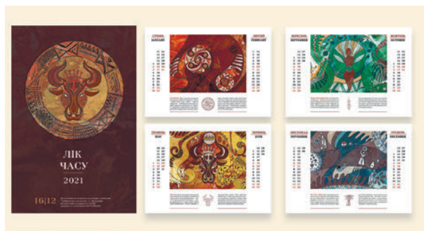
Рис. 6. Дар'я Серова. Фрагмент кваліфікаційного проекту «Символіка Трипільської культури в дизайні сучасного календаря». 2020.