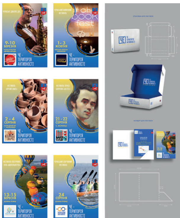
Рис. 7. Денис Остроушко. Фрагмент кваліфікаційного проекту "Дизайн серії листівок "CHE-територія активності". 2022.