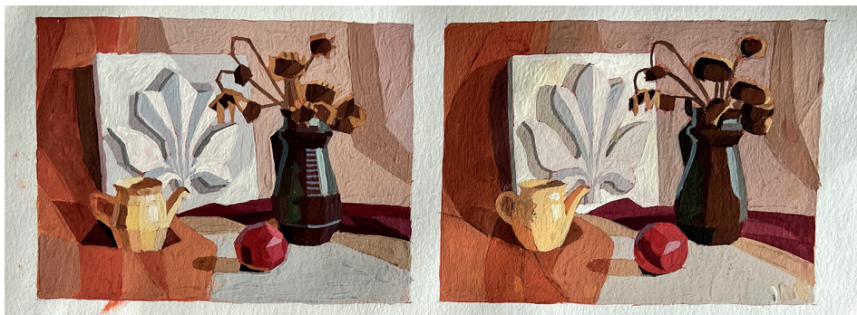
Рис. 4. Мері Асатрян. Приклади ескізів декоративного спрощення холодної і теплої постановки з гіпсовим орнаментом. 2023.