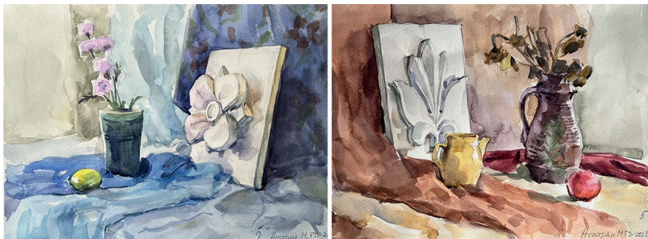
Рис. 2. Мері Асатрян. Приклад реалістичних етюдів натюрмортів холодної й теплої колірної гами з гіпсовим орнаментом. 2023.