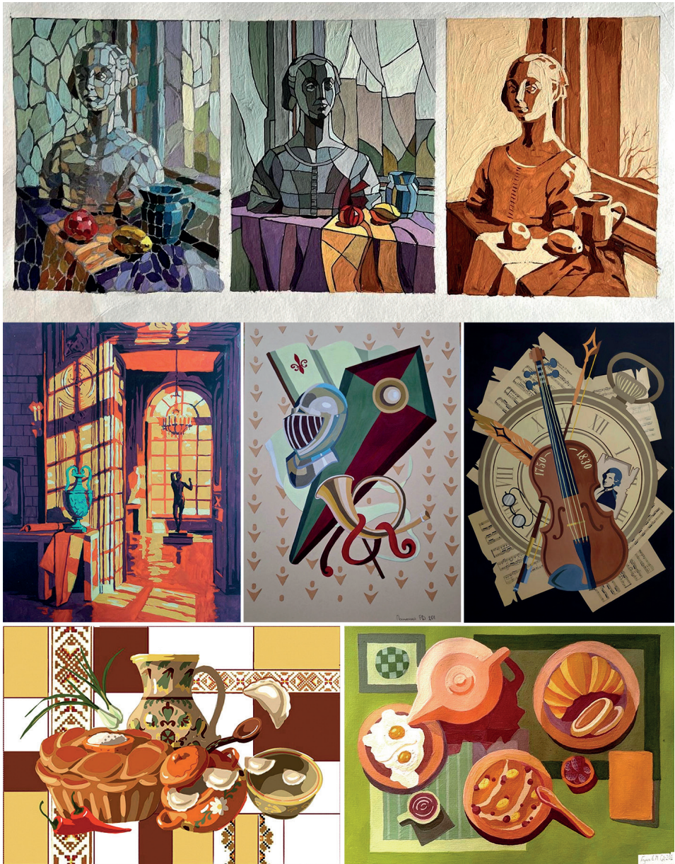
Рис.6. Приклади практичних завдань з декоративного живопису.